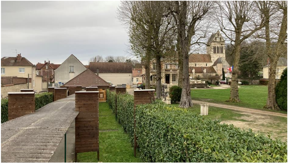
JEU D'ARC DE LA BRUNERIE Inauguré en 1976 13, rue Binder Mestro