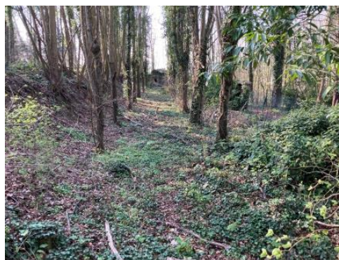
L'allée du Roy vu de l'emplacement de la butte d'attaque.