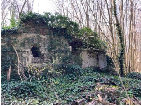
Les Restes du logis