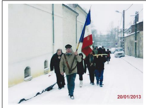
Cortège se rendant à la célébration.