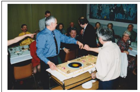
Repas de St Sébastien