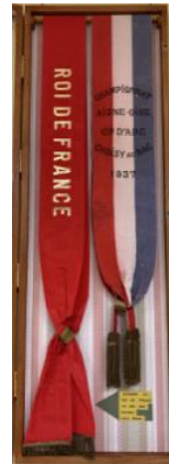
Son écharpe de Roy de France dans une vitrine au logis de la Compagnie