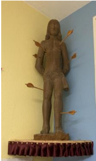
Statue de St Sébastien au logis de la Compagnie

Dans ce cadre, la Compagnie d'arc de Choisy-au-Bac célèbre cette fête chaque année en se rendant à la messe dominicale, en cortège, depuis le jeu d'arc, derrière le drapeau de la Compagnie. Chacun porte une branche d'arc ornée d'un ruban violet. Un repas est pris en commun suite à cette célébration.