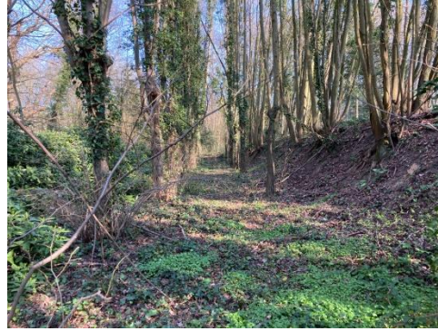
L'allée du Roy vu de l'emplacement de la butte maitresse. Au fond se trouvait la butte d'attaque

Note : à ce jour, la Compagnie d'arc de Choisy est toujours propriétaire du terrain sur lequel était situé ce jeu d'arc. Il s'agit de la parcelle AJ250 (SIREN : U21987254) au plan du cadastre de Choisy.